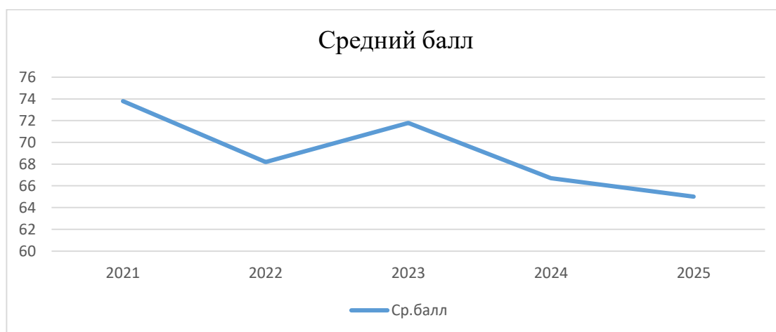
Таблица 6. Динамика значений средних баллов по итогам ЕГЭ по отдельным учебным предметам.